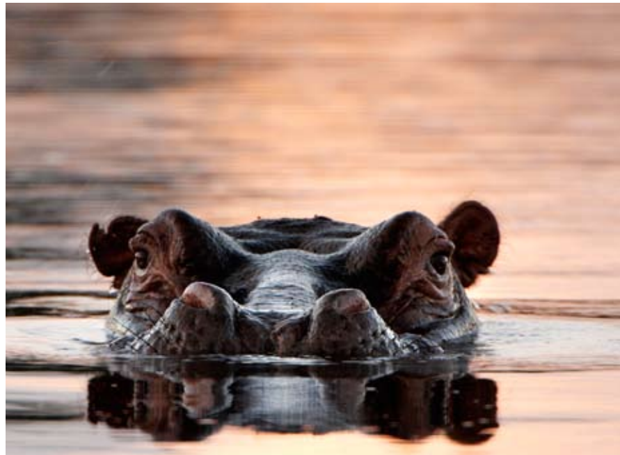
Flodhästen ser harmlös ut men är faktiskt farligare än lejonet.

Högklassig familjeägd safari-lodge som har allt man kan önska till ett jämförelsevis bra pris. Drivs av botswansvensk kvinna. Lodgen har