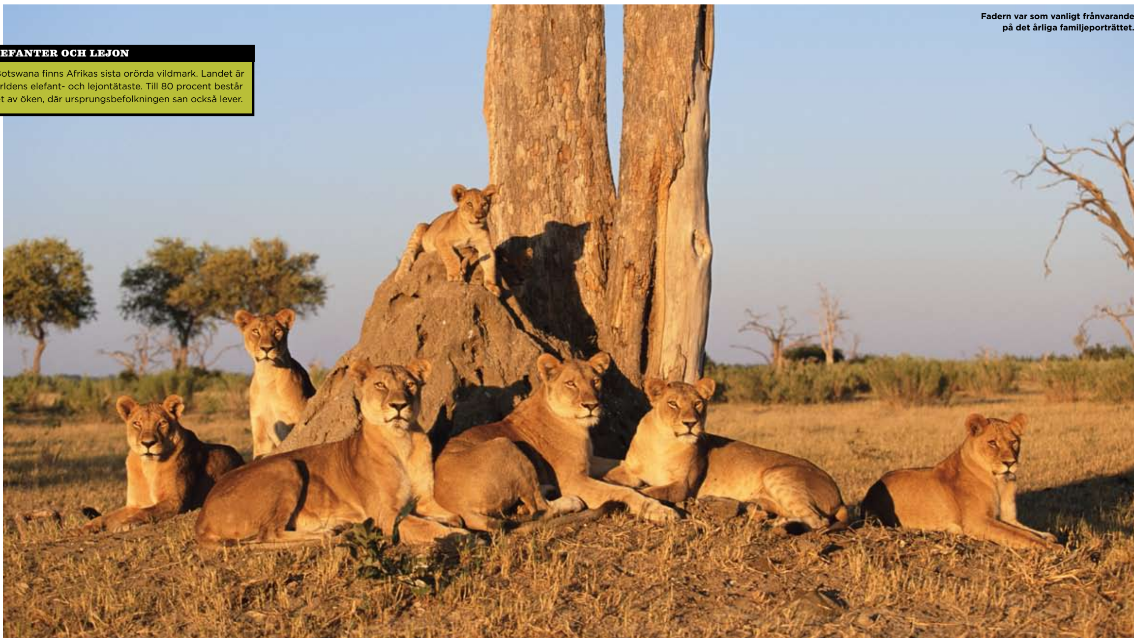
Fadern var som vanligt frånvarande på det årliga familjeporträttet.

I Botswana finns Afrikas sista orörda vildmark. Landet är världens elefant- och lejonstämte. Till 80 procent består det av öken, där ursprungsbefolkningen som också lever.