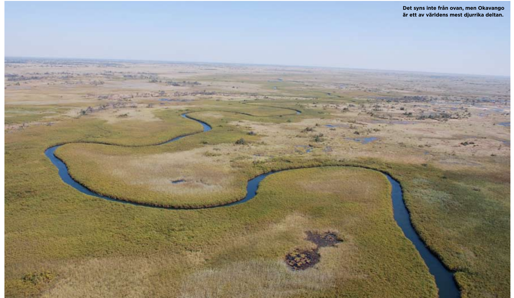
Det syns inte från ovan, men Okavango är ett av världens mest djurrika deltar.

Här finns knappt några människor alls. De vilda djuren rör sig lika fritt som i tidernas begynnelse.