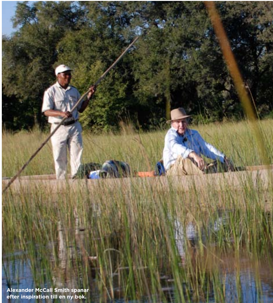
Alexander McCall Smith spanar efter inspiration till en ny bok.

Här finns knappt några människor alls. De vilda djuren rör sig lika fritt som i tidernas begynnelse.