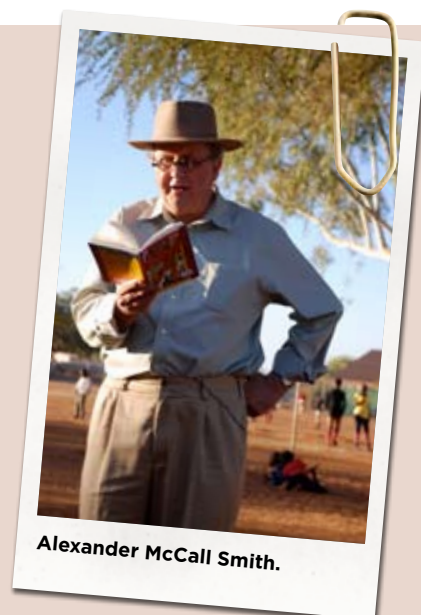
Alexander McCall Smith.