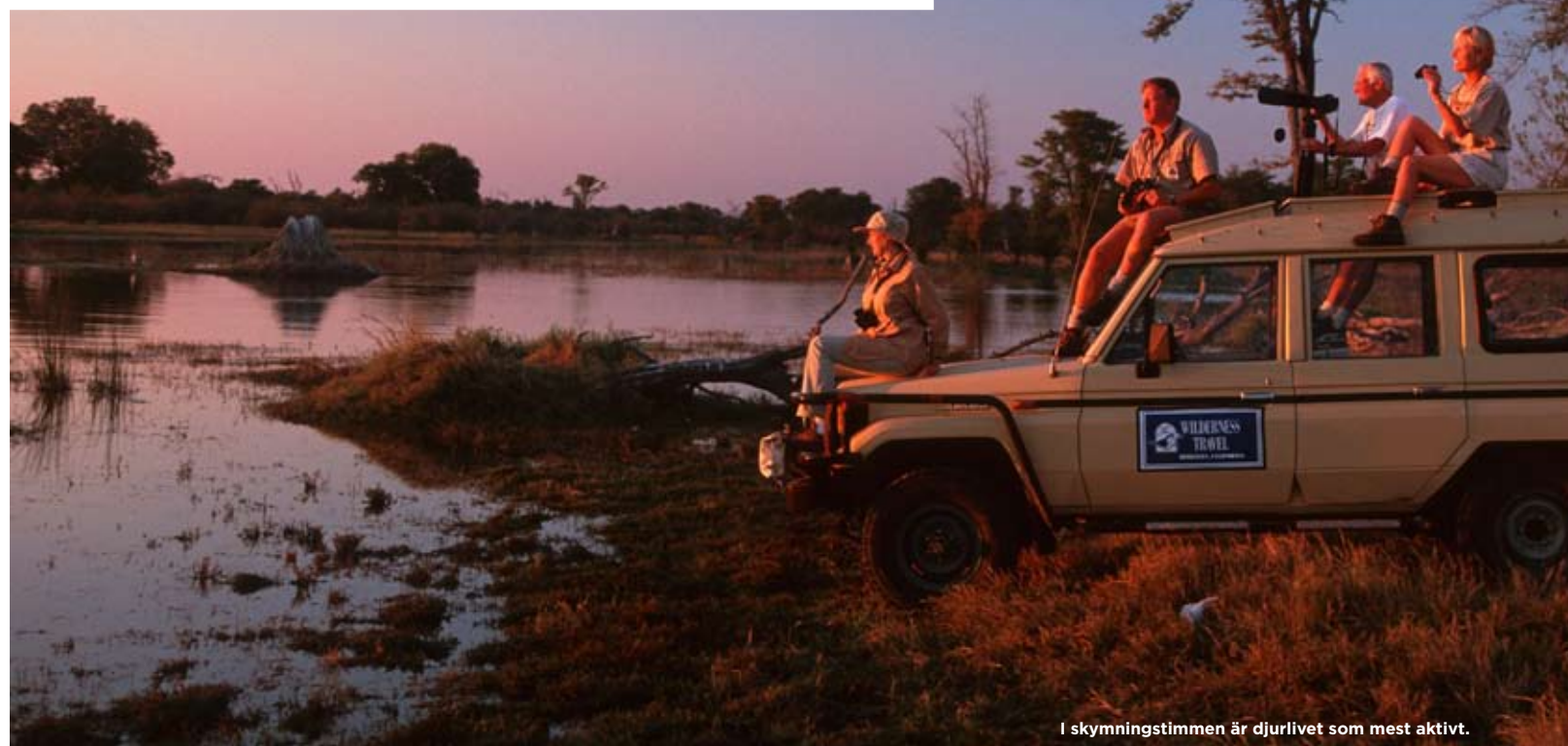
I skymningstimmen är djurlivet som mest aktivt.

Det finns en speciell rytm här, en känsla, som jag vill fånga i mina böcker.